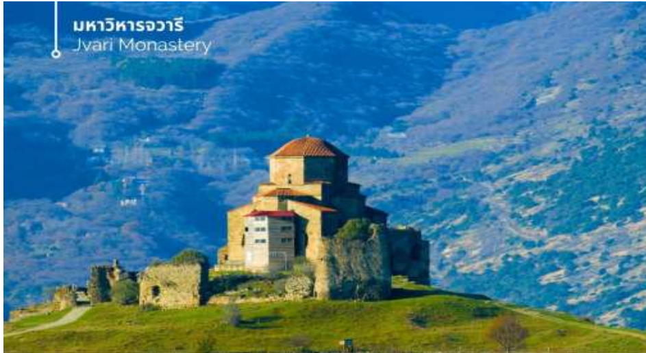
มหาวิหารจวารี Jvari Monastery