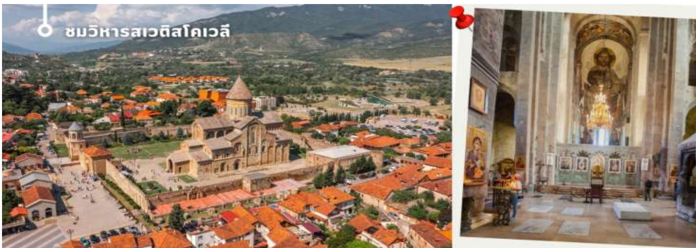
ชมวิหารสเวตสโคเวลี

นำท่านออกเดินทางชม วิหารสเวตสโคเวลี (Svetitskhoveli Cathedral) โบสถ์เก่าแก่ที่ถือเป็นศูนย์กลางทางศาสนาอันศักดิ์สิทธิ์ที่สุดของจอร์เจีย มีขนาดใหญ่เป็นอันดับสองของประเทศ และเป็นศูนย์รวมจิตใจของชาวคริสต์ออร์ทอดอกซ์ สร้างขึ้นในราวศตวรรษที่ 11 ตัวโบสถ์มีสถาปัตยกรรมที่งดงามตามแบบฉบับของจอร์เจีย โดมสูงเด่นตระหง่าน บ่งบอกถึงความยิ่งใหญ่และศักดิ์สิทธิ์ ภายในวิหารประดับประดาด้วยภาพเขียนฝาผนังที่งดงามเล่าเรื่องราวทางศาสนา และยังมีหอคอยสูงที่สามารถมองเห็นวิวเมืองมิชเคต้าได้อย่างสวยงาม