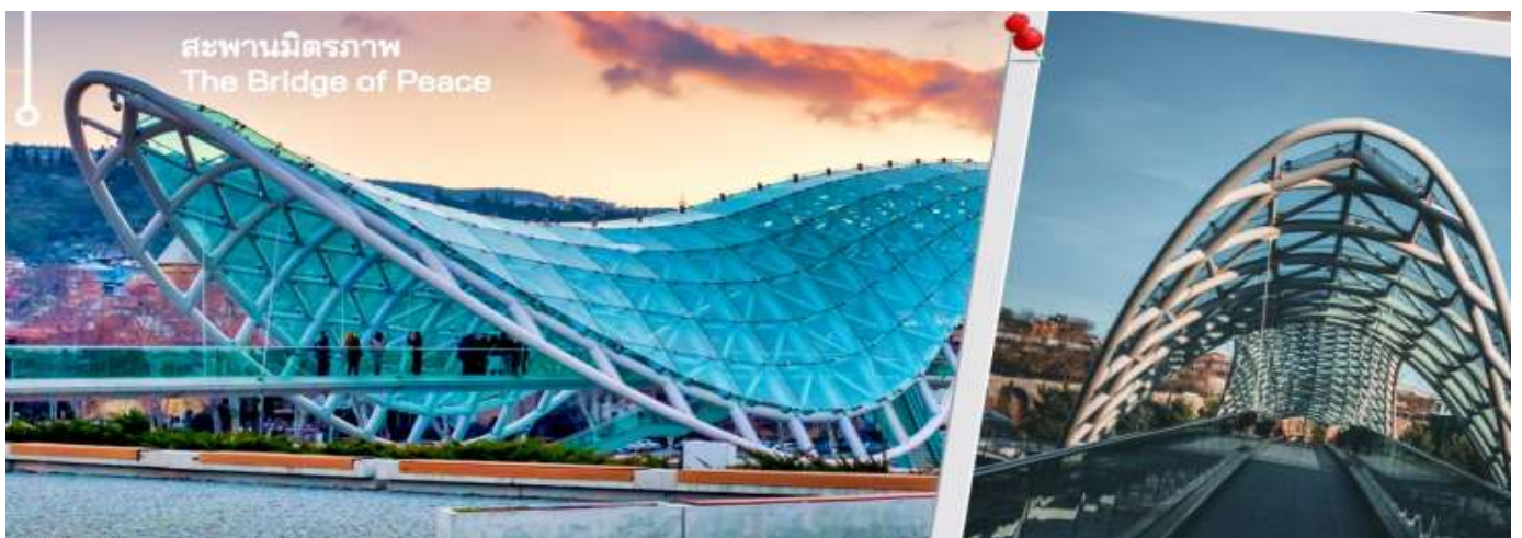
สะพานมิตรภาพ The Bridge of Peace

นำท่านเดินทางไปยัง สะพานสันติภาพ เป็นสะพานคนเดินรูปทรงโค้งสร้างจากเหล็กและ ทอดข้ามแม่น้ำคูราเชื่อมสวนริเกกกับเมืองเก่าในใจกลางกรุงทบิลิซีนับตั้งแต่เปิดให้บริการในปี 2010 โครงสร้างนี้ได้กลายเป็นทางข้ามคนเดินที่สำคัญในเมืองรวมทั้งเป็นสถานที่ท่องเที่ยวที่สำคัญและเป็นหนึ่งในแลนด์มาร์คที่เป็นที่รู้จักมากที่สุดของเมืองหลวง สะพานซึ่งทอดยาว 150 เมตร ข้ามแม่น้ำคูรา ได้รับคำสั่งจากศาลว่าการเมืองทบิลิซีให้สร้างเป็นองค์ประกอบการออกแบบร่วมสมัยที่เชื่อมต่อทบิลิซีเข้ากับเขตใหม่ สะพานทอดยาวข้ามแม่น้ำคูรา ทำให้สามารถมองเห็นโบสถ์เมเตคีรึป็นของผู้ออกตั้งเมืองวิกตัง กอร์กาซาลีและป้อมนาริกาลาทางด้านหนึ่งและสะพานบาราตาชวิลีและพระราชวังพิธีการของจอร์เจียทางอีกด้านหนึ่ง