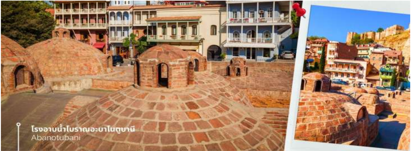
โรงอบน้ำโบราณอะบาโนตูปานี Abanotubani

จากนั้นเดินทางสู่เมืองเก่าจอร์เจียมชเคตา