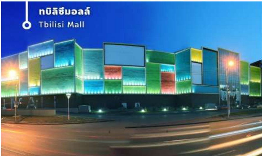
ทบิลิซิมอลล์ Tbilisi Mall