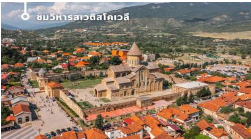
ชมวิหารสเวตสโคเวลี

นำท่านออกเดินทางชม วิหารสเวตสโคเวลี (Svetitskhoveli Cathedral) โบสถ์เก่าแก่ที่ถือเป็นศูนย์กลางทางศาสนาอันศักดิ์สิทธิ์ที่สุดของจอร์เจีย มีขนาดใหญ่เป็นอันดับสองของประเทศ และเป็นศูนย์รวมจิตใจของชาวคริสต์ออร์ทอดอกซ์ สร้างขึ้นในราวศตวรรษที่ 11 ตัวโบสถ์มีสถาปัตยกรรมที่งดงามตามแบบฉบับของจอร์เจีย โดมสูงเด่นตระหง่าน บ่งบอกถึงความยิ่งใหญ่และศักดิ์สิทธิ์ ภายในวิหารประดับประดาด้วยภาพเขียนฝาผนังที่งดงามเล่าเรื่องราวทางศาสนา และยังมีหอคอยสูงที่สามารถมองเห็นวิวเมืองมิชเคต้าได้อย่างสวยงาม