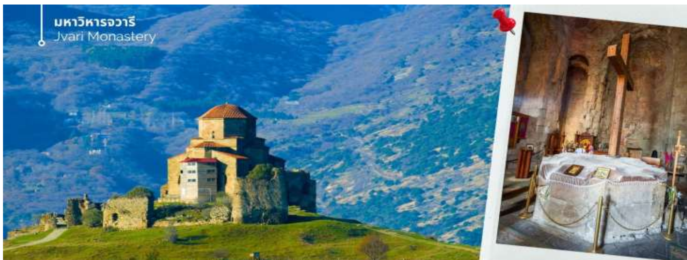
มหาวิหารจวารี Jvari Monastery

จากนั้นอิสระ ถนนคนเดินชาเดอनी (Jan Shardeni Street) เป็นถนนคนเดินสายสั้นๆ ที่ตั้งอยู่ใจกลางย่านเมืองเก่า (Old Tbilisi) ของเมืองหลวงทบิลีซี ประเทศจอร์เจีย ถนนสายนี้ได้รับการยกย่องว่าเป็นหนึ่งในศูนย์รวมทางสังคม ไลฟ์สไตล์ และวัฒนธรรมที่คึกคักที่สุด โดยผสมผสานสถาปัตยกรรมแบบคลาสสิกดั้งเดิมเข้ากับกลิ่นอายความโรแมนติกแบบยุโรป ย่านนี้เต็มไปด้วยอาคารเก่าแก่สไตล์วินเทจ คาเฟ่ริมทาง บาร์ไวน์ และแกลเลอรีศิลปะเก๋ๆ แหล่งแฮงค์เอาท์ยามค่ำ คีนสวรรค์ของคนรักอาหารท้องถิ่นและเลือกซื้อของที่ระลึกที่นี่ได้