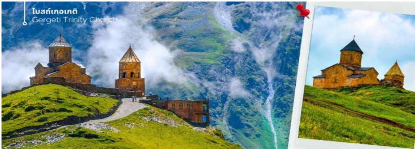
โบสถ์เทอเกตี Gergeti Trinity Church

จากนั้นออกเดินทางสู่ เมืองกูตาอูรี (ใช้เวลาเดินทางประมาณ 1 ชั่วโมง 30 นาที)