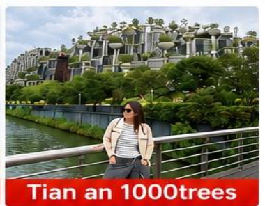
Tian an 1000trees