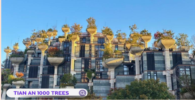
TIAN AN 1000 TREES