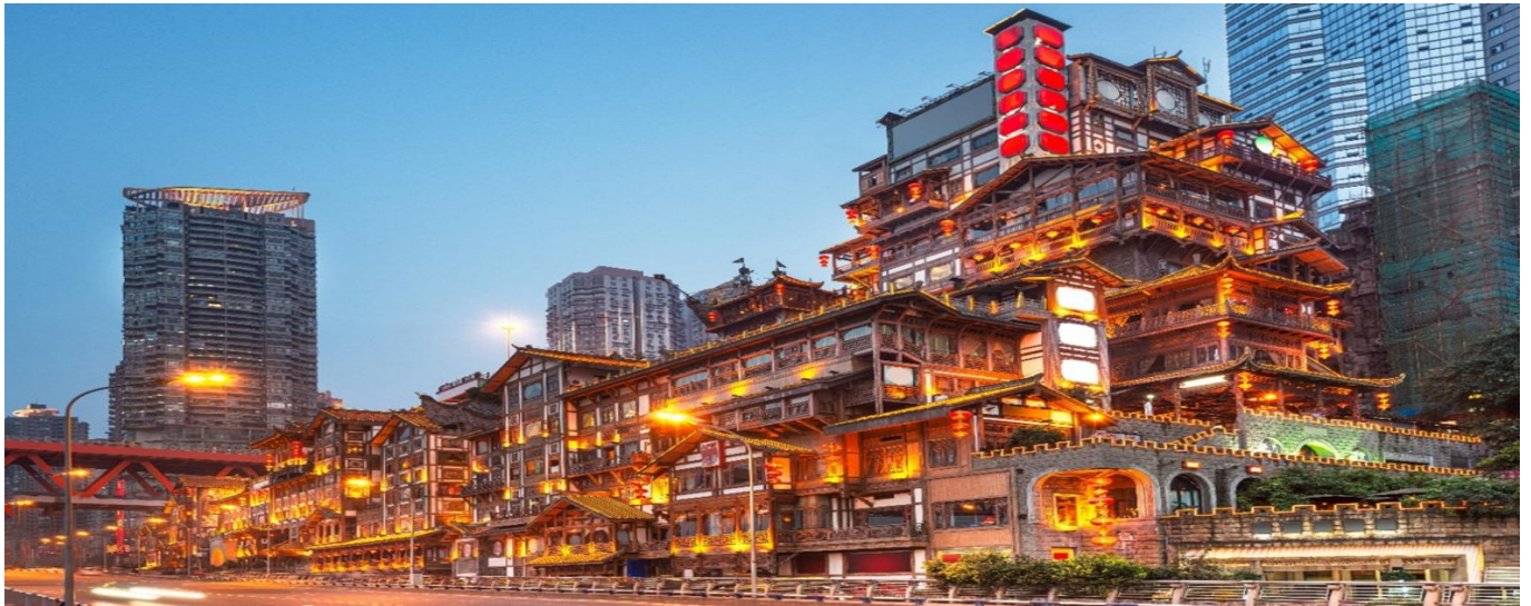
ที่พัก REZEN SUNGO HOTEL หรือระดับเทียบเท่า 4 ดาว