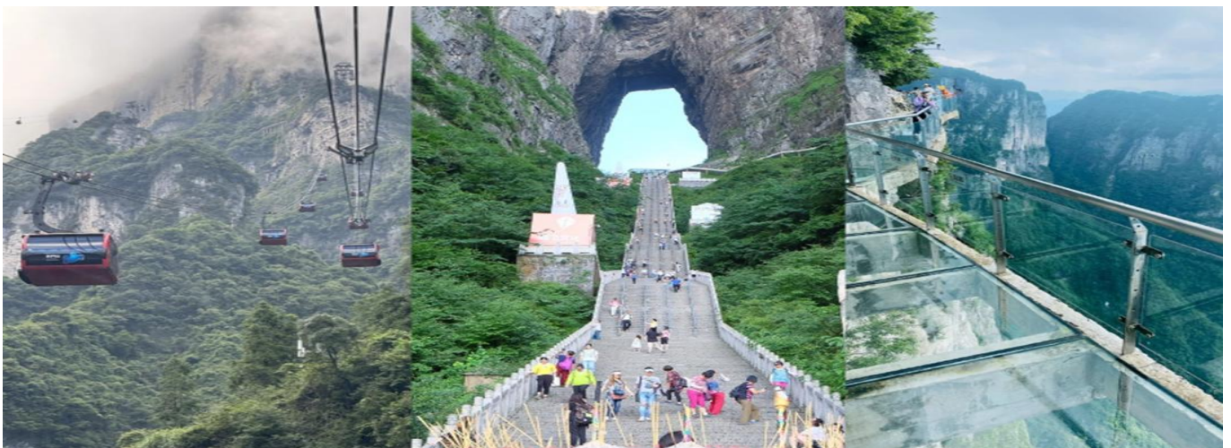
GO1CNXCKG-PN012 เชียงใหม่ ฉงชิ่ง จางเจียเจีย เมืองโบราณผู่หรง เมืองโบราณฟ่งหวง 6 วัน 5 คืน (PN)

กรณีที่กระเช้าหรือรถอุทยานหรือบันไดเลื่อนปิดปรับปรุงเนื่องจากซ่อมบำรุงหรือจากสภาพอากาศ ทั้งนี้เพื่อความปลอดภัยของลูกค้า ทางบริษัทฯจะจัดโปรแกรมอื่นมาทดแทนให้หรือเปลี่ยนแปลงตามความเหมาะสมอย่างใดอย่างหนึ่ง และในสถานการณ์รถของอุทยานขึ้นไปบนถ้ำประตูสวรรค์ หากรถของอุทยานไม่สามารถขึ้นไปถ้ำประตูสวรรค์ได้ ทางบริษัทฯ ขอสงวนสิทธิ์ไม่คืนเงินใดๆทั้งสิ้น โดยยึดตามประกาศจากทางอุทยานเป็นสำคัญโดยที่ไม่แจ้งให้ทราบล่วงหน้า