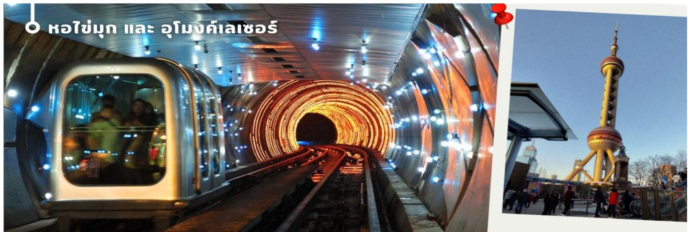
📍 หอไข่มุก และ อุโมงค์เลเซอร์

จากนั้นนำท่าน สู่แลนด์มาร์คของเมืองเซี่ยงไฮ้ นักท่องเที่ยวทั้งชาวจีนและชาวต่างชาติ ต่างพากันมาถ่ายรูปอย่างไม่ขาดสาย เมื่อมาถึงเมืองเซี่ยงไฮ้ นั่นคือ หอไข่มุกตะวันออก Oriental Pearl Tower (ผ่านชม) เป็นหอส่งสัญญาณวิทยุ โทรทัศน์สูง 468 เมตร ลักษณะเป็นไข่มุก 11 ลูก และ เสา 3 เสา ด้านบนเป็นรูปไข่มุก 3 เม็ด 3 ขนาดเรียงกันในแนวตั้ง เมื่อชมวิว ถ่ายรูปกันจนหน้าใจแล้ว นำท่านเดินมาทางเข้าอุโมงค์เลเซอร์ ซึ่งเป็นอุโมงค์ลอดแม่น้ำแห่งแรกในประเทศจีน โดยอุโมงค์นี้จะพาเราเดินทางข้ามจากฝั่งหอไข่มุกตะวันออก ของหาดไว่ทาน จากนั้นนำท่านเดินมาถ่ายรูปคู่หอไข่มุก แวะชมความอลังการของ Disney Store Shanghai สาขาที่ใหญ่ที่สุดในโลก