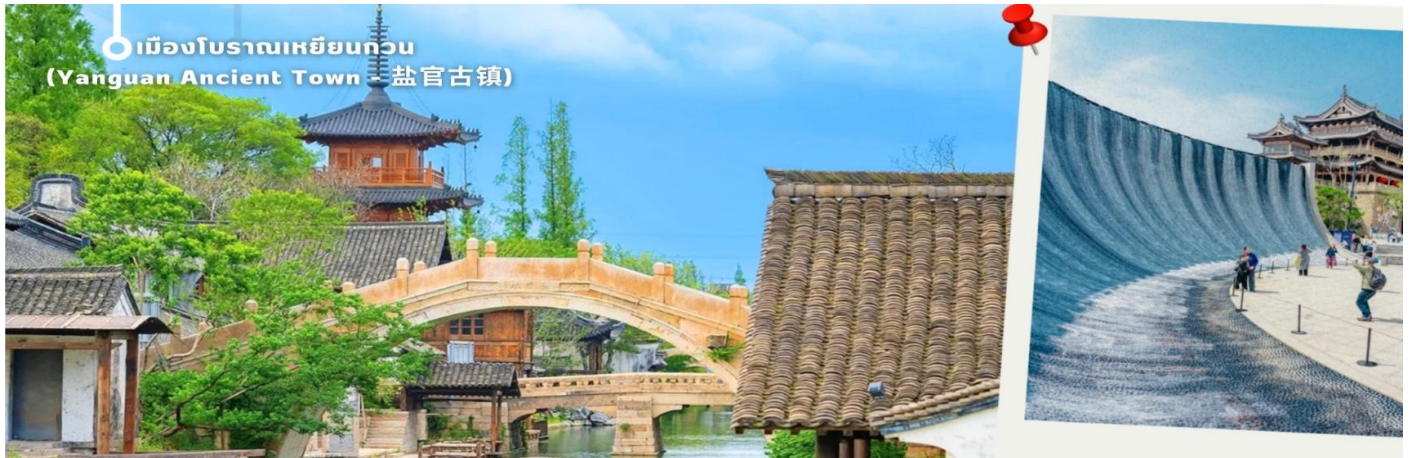
เมืองโบราณเหยียนกวน (Yanguan Ancient Town - 盐官古镇)

แวะชมผลิตภัณฑ์จากหยก งานฝีมืออันสวยงาม ขึ้นชื่อของจีนถือว่าถ้าใครมาจีนต้องแวะชมผลงานที่ผลิตจากหยก น่าเก็บสะสมเป็นอย่างมาก จากนั้นนำท่านเดินทางกลับเมือง เซี่ยงไฮ้ (ใช้เวลาเดินทางประมาณ 2 ชั่วโมง) นำท่านช้อปปิ้งย่าน ถนนนานจิง Nanjinglu Street ศูนย์กลางสำหรับการช้อปปิ้งที่คึกคักมากที่สุดของนครเซี่ยงไฮ้ รวมทั้งห้างสรรพสินค้าใหญ่ชื่อดังกว่า 10 ห้าง และช้อปปิ้ง ร้าน POP MART สุดฮิตในขณะนี้เพื่อเป็นของฝากที่ระลึก นำท่านสู่บริเวณ หาดว๋ายทาน ตั้งอยู่บนฝั่งตะวันตกของแม่น้ำหวงผู้มีความยาวจากเหนือจรดใต้ถึง 4 กิโลเมตร เป็นเขตสถาปัตยกรรมที่ได้ชื่อว่า “พิพิธภัณฑ์สิ่งก่อสร้างหมื่นปีแห่งชาติจีน” ถือเป็นสัญลักษณ์ที่โดดเด่นของมหานครเซี่ยงไฮ้