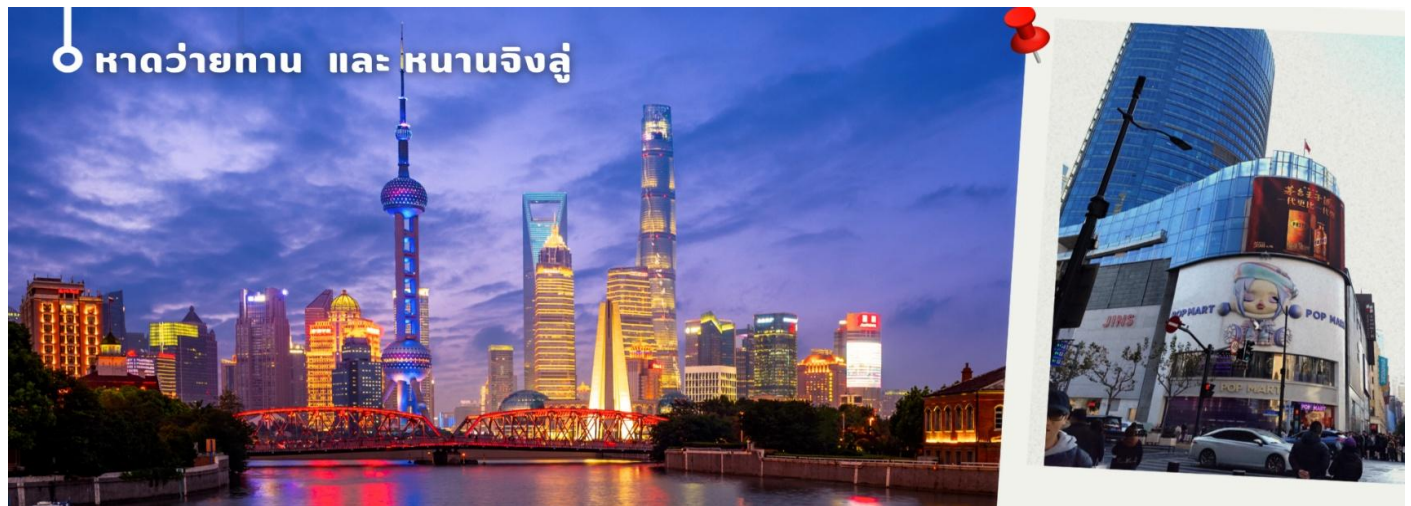
หาดว๋ายทาน และ หานานจิงลู่

แวะชมผลิตภัณฑ์จากหยก งานฝีมืออันสวยงาม ขึ้นชื่อของจีนถือว่าถ้าใครมาจีนต้องแวะชมผลงานที่ผลิตจากหยก น่าเก็บสะสมเป็นอย่างมาก จากนั้นนำท่านเดินทางกลับเมือง เซี่ยงไฮ้ (ใช้เวลาเดินทางประมาณ 2 ชั่วโมง) นำท่านช้อปปิ้งย่าน ถนนนานจิง Nanjinglu Street ศูนย์กลางสำหรับการช้อปปิ้งที่คึกคักมากที่สุดของนครเซี่ยงไฮ้ รวมทั้งห้างสรรพสินค้าใหญ่ชื่อดังกว่า 10 ห้าง และช้อปปิ้ง ร้าน POP MART สุดฮิตในขณะนี้เพื่อเป็นของฝากที่ระลึก นำท่านสู่บริเวณ หาดว๋ายทาน ตั้งอยู่บนฝั่งตะวันตกของแม่น้ำหวงผู้มีความยาวจากเหนือจรดใต้ถึง 4 กิโลเมตร เป็นเขตสถาปัตยกรรมที่ได้ชื่อว่า “พิพิธภัณฑ์สิ่งก่อสร้างหมื่นปีแห่งชาติจีน” ถือเป็นสัญลักษณ์ที่โดดเด่นของมหานครเซี่ยงไฮ้