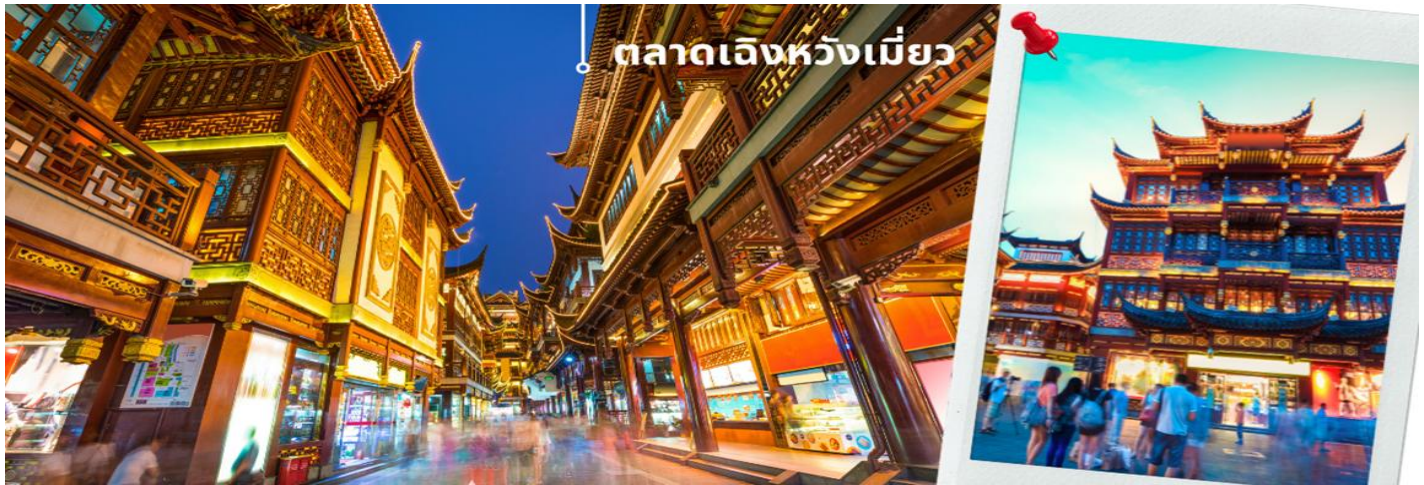
ตลาดเจิ้งหวังเมี่ยว

❗ อิสระอาหารค่ำตามอัธยาศัย เพื่อสะดวกแก่ท่านในการเดินช้อปปิ้งและถ่ายรูป ได้อย่างเต็มที่