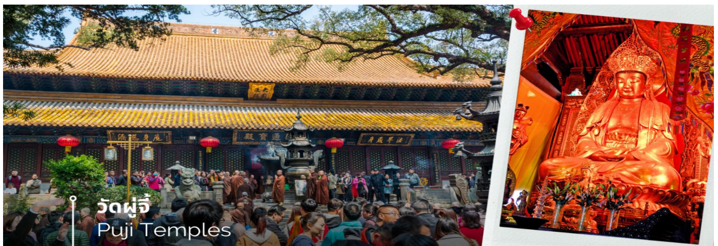
วัดผู้จี Puji Temples

หลังจากนั้นนำท่านนมัสการองค์พระโพธิสัตว์ เจ้าแม่กวนอิมไม่ยอมไป วัดไผ่สีม่วง อีกหนึ่งวัดที่ตั้งอยู่บนเกาะผู้โถวซาน ซึ่งที่นี่ได้รับสมญานามว่า “เกาะพระโพธิสัตว์” เพราะเป็นวัดเล็กๆ ที่อยู่ติดกับทะเล สาเหตุที่เรียกว่าวัดไผ่สีม่วงเพราะว่าบริเวณนั้นมีต้นไผ่สีม่วงขึ้นเยอะ และความพิเศษอีกอย่างหนึ่งคือ ต้นไผ่สีม่วงจะมีในเกาะแห่งนี้ที่เดียว สำหรับไฮไลท์เด็ดของที่นี่คือ “เจ้าแม่กวนอิมไม่ยอมไป” ซึ่งวัดนี้มีประวัติมาอย่างยาวนาน ตั้งแต่สมัยราชวงศ์ถัง (ค.ศ. 961) ซึ่งเป็นยุคที่พุทธศาสนามีความเจริญรุ่งเรืองในแผ่นดินจีน พระโพธิสัตว์ศักดิ์สิทธิ์องค์นี้ไม่ยอมรับอัญเชิญไปประดิษฐานที่ญี่ปุ่นตามการอัญเชิญของหลวงพ่อยุ้ยเอ้อ ภิกษุชาวญี่ปุ่นที่มาศึกษาพระธรรม องค์ท่านจึงได้ดลบันดาลให้เกิดพายุฝนจนไม่