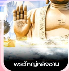
พระโททลึงซาน