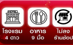
โรงแรม 4 ดาว อาหาร 9 มือ บาร์ร้านช้อปปิ้ง