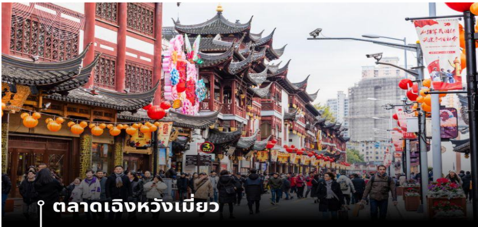
📍 ตลาดเจิ้งเหมียว

นำท่านอิสระช้อปปิ้ง Florentia Village Outlet ห้างเอาท์เล็ตส์ขนาดใหญ่ที่รวบรวมแบรนด์เตอร์แบรนด์ชั้นนำต่างๆ มากมายให้ท่านเลือกช้อปปิ้งไม่ว่าจะแบรนด์ BALENCIAGA, GUCCI, BALENCIAGA, GUCCI, GUESS, PRADA, SAINT LAURENT PARIS, BURBERRY, ADIDAS, CONVERSE และอีกมากมาย ให้ท่าน ช้อปปิ้ง เป็นของฝากแก่ญาติสนิท มิตรสหาย และที่นี้เป็นมากกว่าการช้อปปิ้ง เพราะที่นี่มีเมืองจำลองในอิตาลีที่มีลำคลองและเรือกอนโดลาและสถาปัตยกรรมยุโรปคลาสสิกจำลองสามารถถ่ายรูปเช็คอินสไตล์ยุโรปได้อีกด้วย