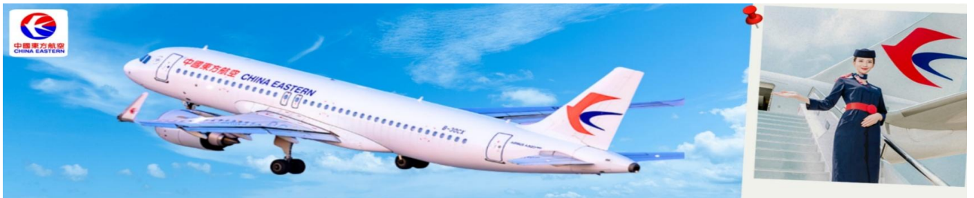
CMUPVG16 เชียงใหม่-ดิสนีย์แลนด์-อุซึ 5วัน 3คืน บิน MU China Eastern (Sep-Dec 26) ไม่ลงร้าน

วันแรก สุวรรณภูมิ-ออกเดินทางสู่เมืองเชียงใหม่ 22.30 น. พร้อมกันที่ ท่าอากาศยานสุวรรณภูมิ ณ อาคารผู้โดยสารขาออกชั้น 4 เคาน์เตอร์ สายการบิน China Eastern (MU) โดยมีเจ้าหน้าที่จากทางบริษัทฯ คอยต้อนรับ และอำนวยความสะดวก