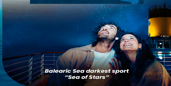
Balearic Sea darkest sport "Sea of Stars"