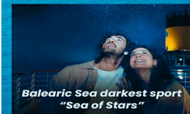
Balearic Sea darkest sport "Sea of Stars"