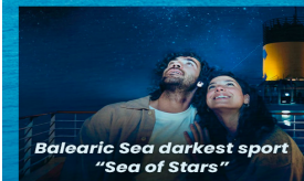
Balearic Sea darkest sport "Sea of Stars"