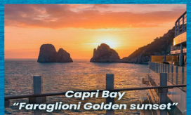
Capri Bay "Faraglioni Golden sunset"