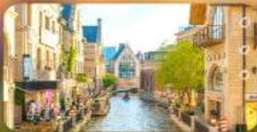
เมืองน้ำเวนิสตะวันออก