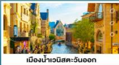
เมืองน้ำวนิสตะวันออก