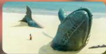
ประติมากรรมวาฬโดคเตี้ยว