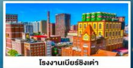
โรงงานเบียร์ซิงเต่า