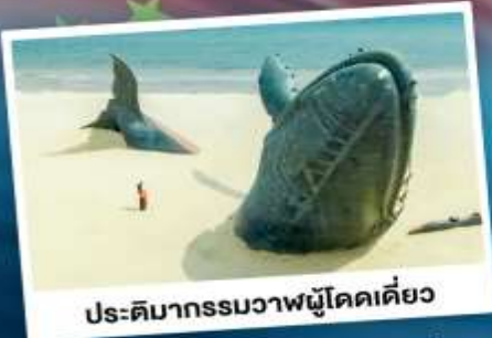
ประติมากรรมวาฬผู้โดดเดี่ยว

เที่ยวเมืองชายทะเลโอปิตีดี ซิงเต่า - ต้าเหลียน - ฉะจีงนไถ