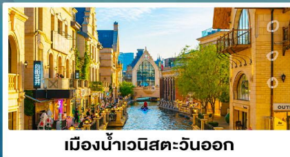
เมืองน้ำวนิสตะวันออก