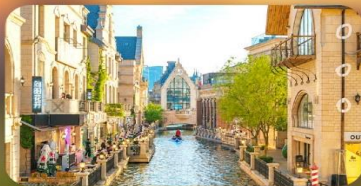
เมืองน้ำเวนิสตะวันออก