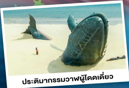
ประติมากรรมวาฬผู้โดดเดี่ยว

เที่ยวเมืองชายทะเลโอปิตีดี ซิงเต่า - ต้าเหลียน - ฉะจีงนไถ