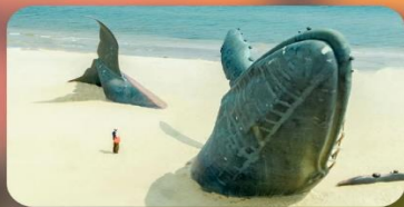
ประติมากรรมวาฬโดคเตี้ยว