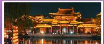
เมืองโบราณลั่วयी