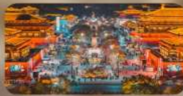
ถนนวัฒนธรรมราชวงศ์ถัง