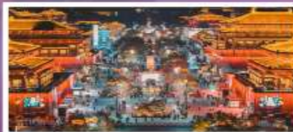
ถนนวัฒนธรรมราชวงศ์ถัง