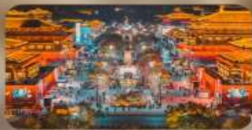
ถนนวัฒนธรรมราชวงศ์ถัง