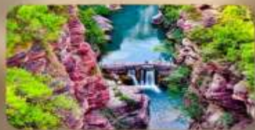
อุทยานหยุ่นโตซาน