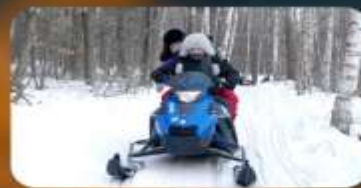
จักรยาน SNOW MOTORCYCLE