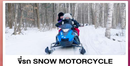
ขี่รถ SNOW MOTORCYCLE