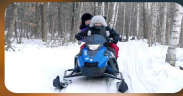
จักรยาน SNOW MOTORCYCLE