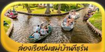
คลองเรือชมหมู่บ้านกังหัน