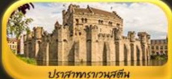
ปราสาทราเวนสตีน