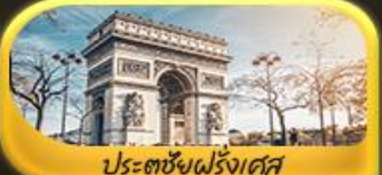
ประตูชัยฝรั่งเศส

พิเศษ!! ล่องเรือแม่น้ำแซนชมเมือง โดย บาโต มูช