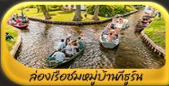
ล่องเรือชมหมู่บ้านกังหัน