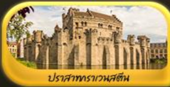
ปราสาทราวาสตี