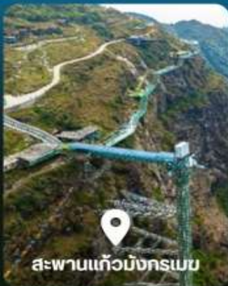
สะพานแก้วมิงกรบม