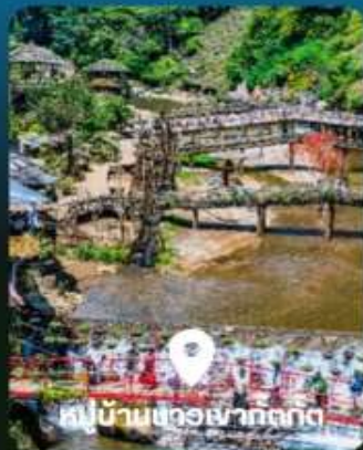
หมู่บ้านชาวเผ่ากตัก