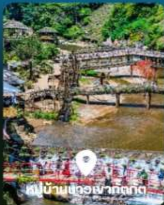
หมู่บ้านชาวเผ่ากตัก