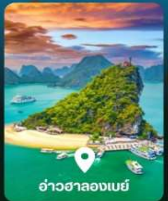
อ่าวฮาลองเบย์