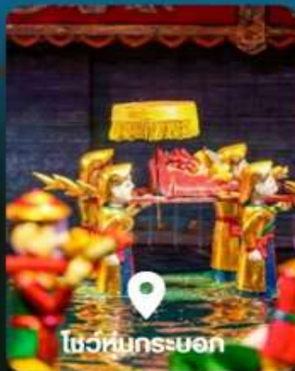
ไขว่หน้กระบอก