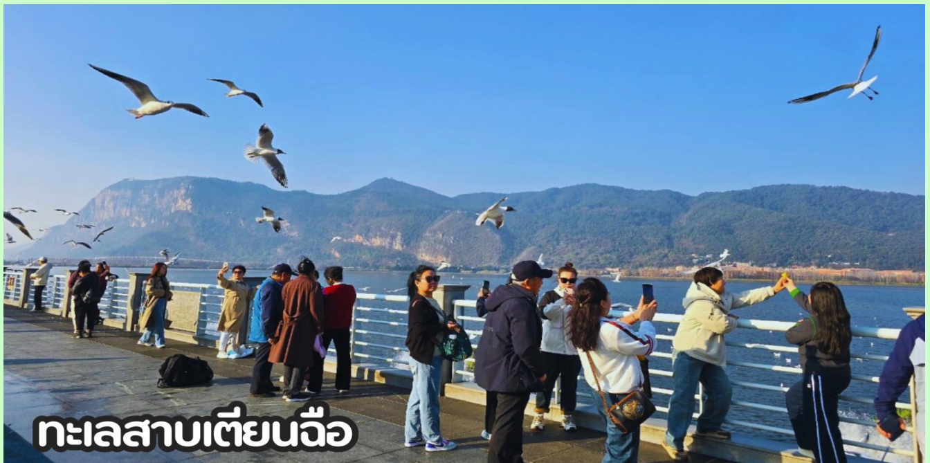
ทะเลสาบเตียนฉือ

**สำหรับท่านที่ไม่ต้องการซื้อออฟชั่นเสริม สามารถอิสระช้อปปิ้งที่ถนนคนเดินใกล้เคียงกันได้**