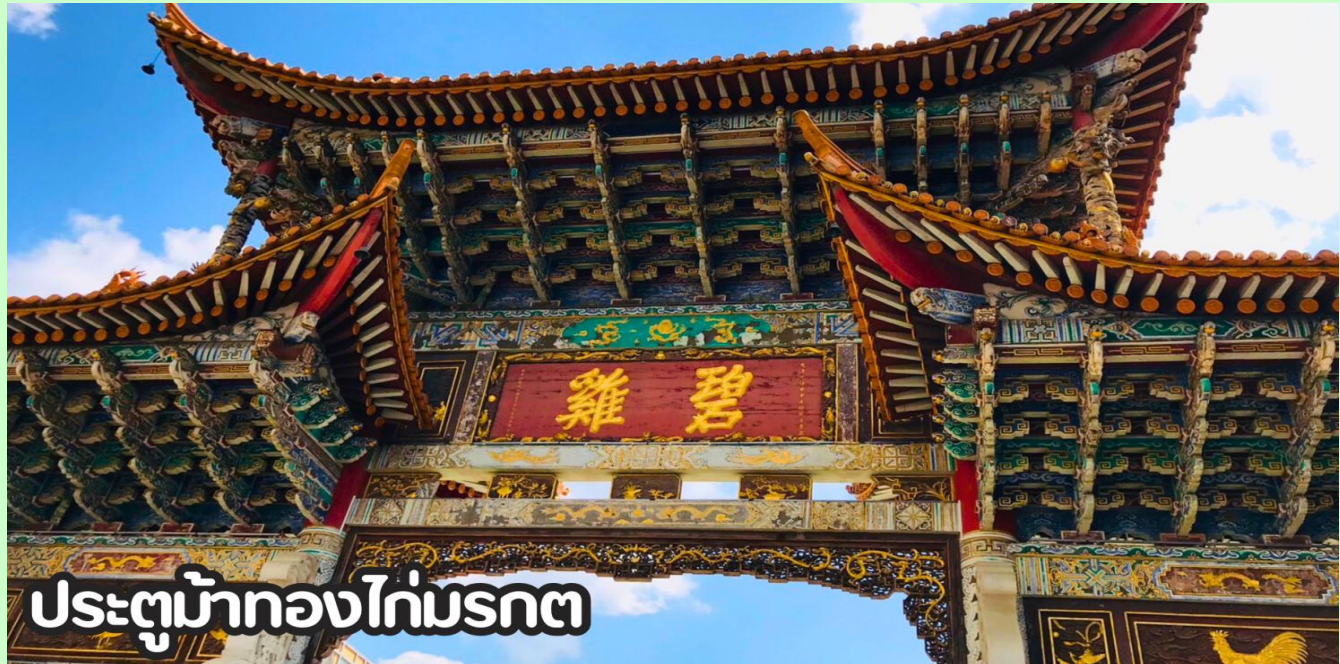
ประตูม้าทองไก่มรกต

แวะช้อปปีง POP MART อีสระให้ท่านได้เลือกช้อปตามอัธยาศัย น้อง Cry Baby The dressing Room น้อง Hiroshi เด็กชายที่ ทำหน้าเศร้าตลอดเวลา น้องมอลลี่ น้องลาบูบู้ Pop Bean ตุ๊กตาคารทอยและของสะสมอีกมากมาย จนถึงเวลานัดหมาย