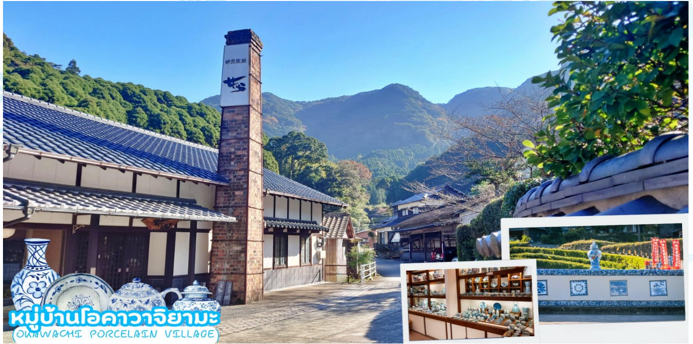
หมู่บ้านโอคาวาจิยามะ OKAWACHI PORCELAIN VILLAGE

รับประทานอาหารเช้า ณ ห้องอาหารของโรงแรม (มื้อที่ 5)