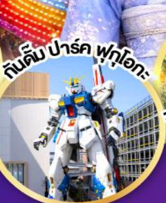
กันดั้ม ปาร์ค ฟุจิโอกะ