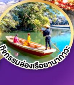
กิจกรรมล่องเรือยามาโทกะ