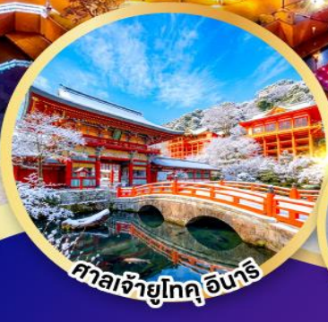
ศาลเจ้าฟูจิอินาริ