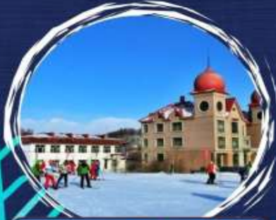
สถานศึกษาบูตี