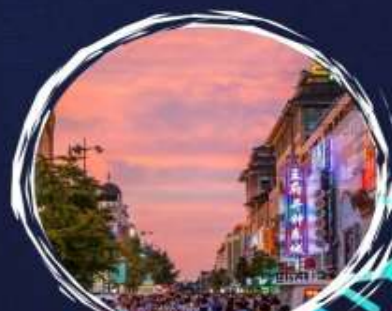
ถนนหวิงฝูฉิง

แถมฟรี!! ถุงมือ ที่ครอบบหุ หมวก ผ้าพันคอ