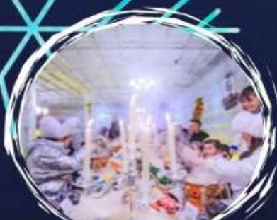
Suki Dome Ice