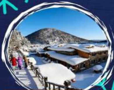
จุดชมวิว+ป่าสนหิมะ