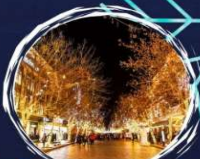
ถนนจงหยาง