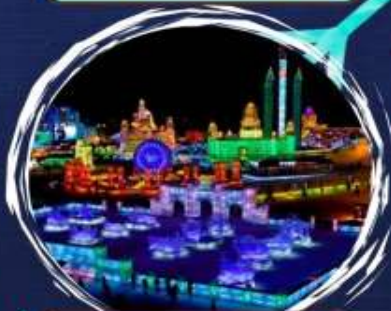
เทศกาลน้ำแข็ง