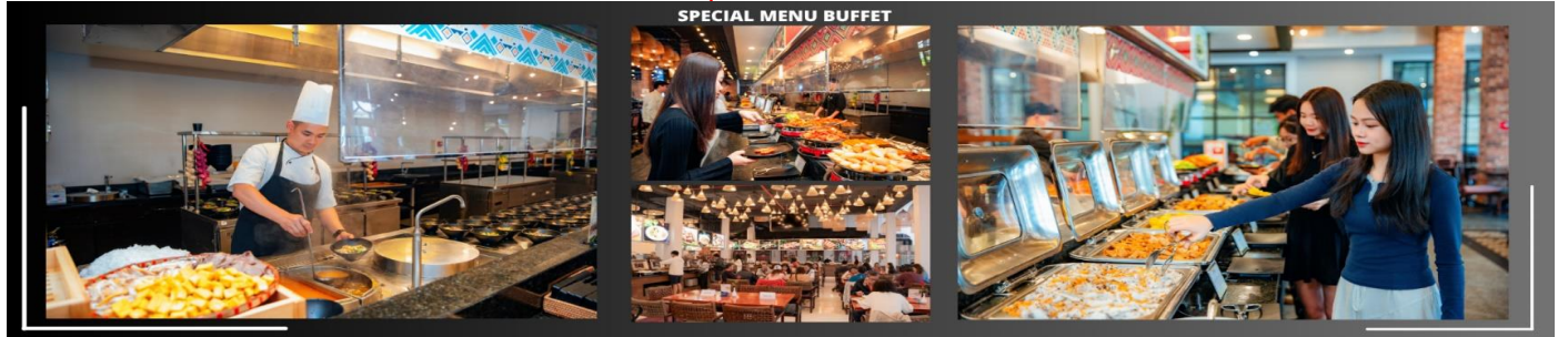
SPECIAL MENU BUFFET