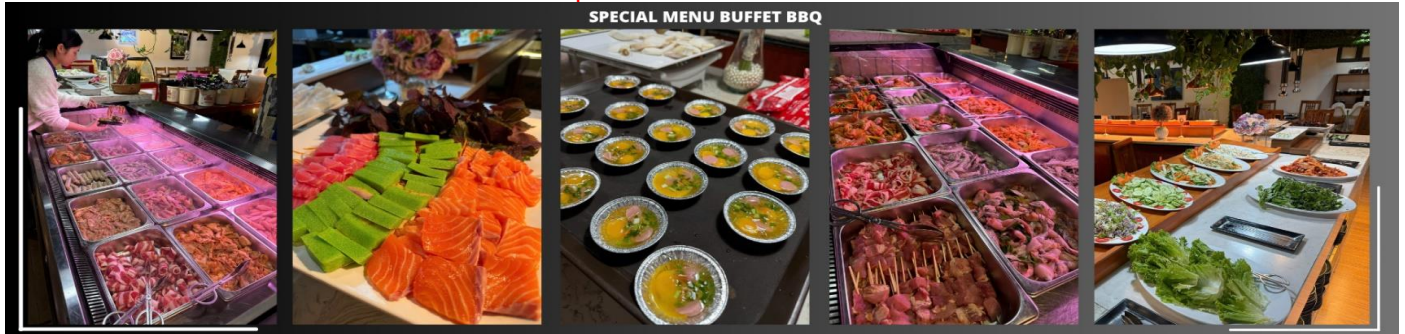
SPECIAL MENU BUFFET BBQ

รับประทานอาหารค่ำ ณ ภัตตาคาร บุฟเฟ่ต์ BBQ (3)