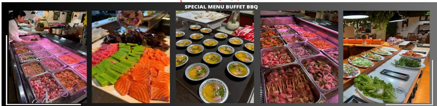
SPECIAL MENU BUFFET BBQ

รับประทานอาหารค่ำ ณ ภัตตาคาร บุฟเฟต์ BBQ (3)