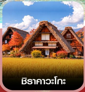
ชิราคาวะโกะ