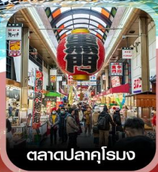
ตลาดปลาคูโรมง