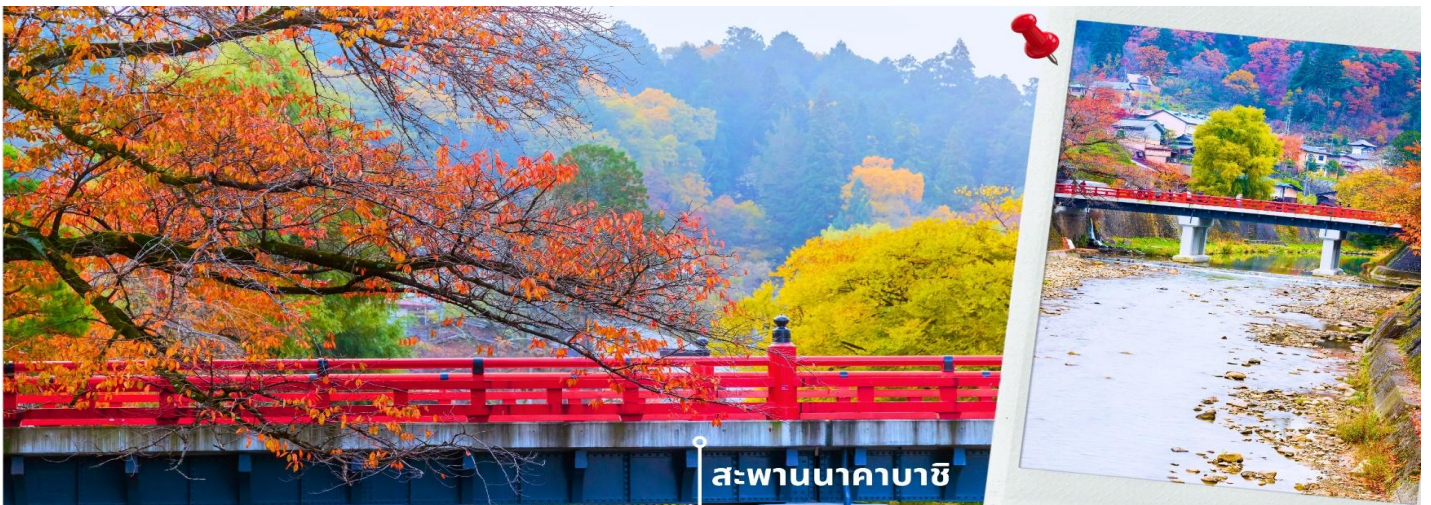
สะพานนาคาบาชิ

เที่ยง รับประทานอาหารเที่ยง ณ ภัตตาคาร (2) เมนูพิเศษ เช็ดหมูย่างไบโฮบะ จากนั้นนำท่านเดินทางสู่ เมืองทาคายามา ซึ่งเป็นเมืองเล็กๆ ที่ตั้งอยู่ในจังหวัดกิฟุ ที่ห้อมล้อมไปด้วยภูเขาและธารน้ำใส พาท่านแวะถ่ายรูปและชมวิวที่ สะพานนาคาบาชิ เป็นสะพานที่สามารถเห็นได้ชัดเจนจากสีที่แดงเข้ม อีกทั้งสะพานแห่งนี้ยังเป็นสัญลักษณ์ที่สำคัญจุดหนึ่งของเมือง โดยเฉพาะใบไม้เปลี่ยนสีที่จะมีใบไม้สีสันสดใสสะพรั่งอยู่รายล้อมตัวสะพาน จนกลายเป็นจุดชมวิวยอดนิยมแห่งหนึ่งของเมืองทาคายามา