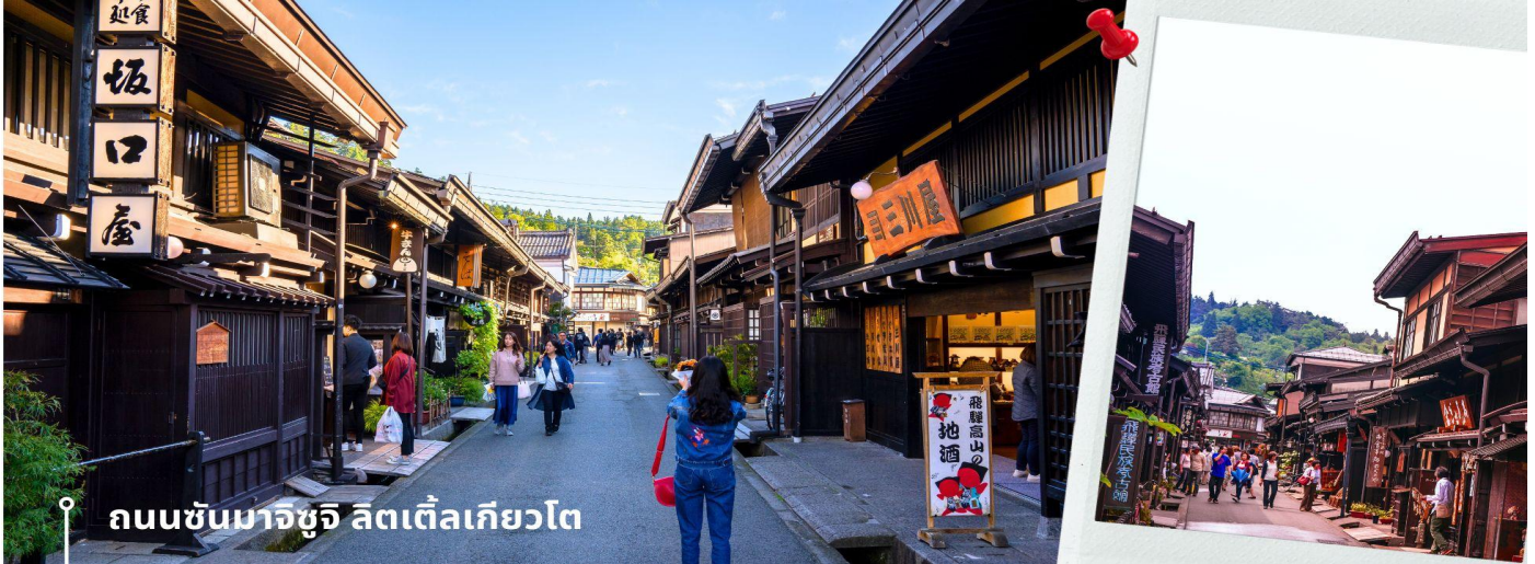
ถนนซันมาจิซูจิ ลิตเติ้ลเกียวโต

จากนั้นให้เวลาท่านเดินเล่นสัมผัสบรรยากาศกันต่อที่ ถนนซันมาจิซูจิ ซึ่งถูกขนานนามว่าเป็น “ลิตเติ้ลเกียวโต” บ้านไม้โบราณโทนสีน้ำตาลดำ เรียงรายไปตามทางเดิน มีคูน้ำอยู่รอบเมือง ปัจจุบันได้มีการปรับเปลี่ยนเป็นร้านค้า ร้านอาหาร ของที่ระลึก สำหรับนักท่องเที่ยวให้ได้เลือกชมทั้ง ผ้าแฮนด์เมด ชุดยูกาตะ ตุ๊กตาซารุโอะโอะ