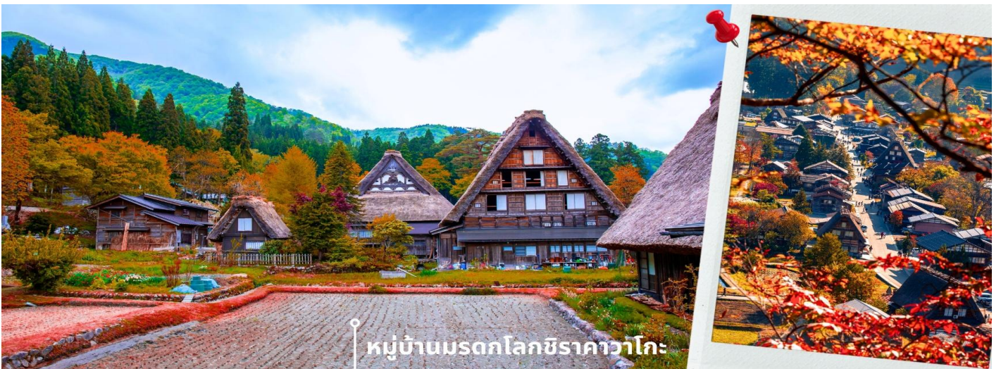
หมู่บ้านมรดกโลกชิราคาวาโกะ

จากนั้นนำท่านเดินทางสู่ เมืองกิฟุ พาท่านเข้าชม หมู่บ้านมรดกโลกชิราคาวาโกะ หมู่บ้านแห่งนี้ ตั้งอยู่ในหุบเขาสูงท่ามกลางความเจริญ ทำให้ยังรักษาขนบธรรมเนียม ประเพณีอันดั้งเดิมไว้ได้อย่างสมบูรณ์ และเป็นหมู่บ้านที่มีรูปร่างแปลกตาติดอันดับ ซึ่งได้ชื่อว่าเป็น The most beautiful village in Japan โดยมีบ้านทรงแบบ “กัสโซสึคุริ” ซึ่งเป็นบ้านชาวนาโบราณที่มีอายุมากกว่า 250 ปี คำว่า กัสโซ มีความหมายว่า พนมมือ ซึ่งคล้ายกับรูปแบบของบ้านที่มีหลังคามุงด้วยฟางข้าวที่ทำมุมชันถึง 60 องศา ราวกับสองมือที่ประนมเข้าหากัน ตัวบ้านมีความยาวประมาณ 18 เมตร กว้าง 10 เมตร ทั้งหลังถูกสร้างขึ้นโดยไม่ใช้ตะปู ภายหลังในปี 1995 ได้รับการตั้งขึ้นเป็นมรดกโลก