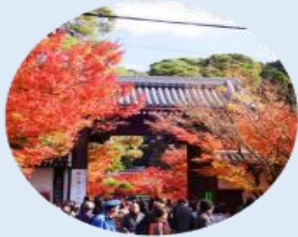
จุดประตูโซมง เป็นประตูทางเข้าหลักของวัดเอคันโด

นำท่านเดินทางสู่ เกียวโต เป็นเมืองที่ได้ชื่อว่าเมืองแห่งศิลปะและวัฒนธรรมของญี่ปุ่นอย่างแท้จริง จากนั้นนำท่านเยี่ยมชม วัดเอคันโด (Eikan-do) วัดสวยที่มีชื่อเรียกขานถึง 3 ชื่อ ไม่ว่าจะเป็น เซนรินจิ, โชจูโรงะซัง หรือ มูเรียวจูอิน วัดนี้ตั้งอยู่บริเวณปลายสุดทางทิศใต้ของ "ทางเดินนักปราชญ์" ในย่านฮิงาชิยามะ โดดเด่นด้วยอาคารไม้โบราณที่เชื่อมถึงกันด้วยทางเดินไม้หลังคาคลุมลัดเลาะไปตามสวน วัดเอคันโด มีประวัติศาสตร์ยาวนานตั้งแต่สมัยเออัน โดยเริ่มจากขุนนางระดับสูงได้มอบพื้นที่แห่งนี้ให้เป็นที่พำนักของพระสงฆ์ ภายในวัดเต็มไปด้วยงานศิลปะที่ทรงคุณค่า โดยเฉพาะ รูปปั้นพระอมิตาพุทธ ที่มีเอกลักษณ์ไม่เหมือนใคร เพราะพระเศียรจะหันไปทางด้านข้าง ซึ่งมีตำนานเล่าว่า พระองค์เคยหันมาพูดคุยกับเจ้าอาวาสนั่นเอง นอกจากนี้ ที่นี่ยังเป็น "แลนด์มาร์ค" อันดับหนึ่งสำหรับการชมใบไม้เปลี่ยนสีในช่วงปลายเดือน พฤศจิกายน ซึ่งจะสวยงามเป็นพิเศษทำให้บรรยากาศดูราวกับอยู่ในเทพนิยาย ภายในวัดมีมุมถ่ายรูปเก๋ๆ กับใบไม้แดงเพียง