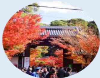
จุดประตูโซมง เป็นประตูทางเข้าหลักของวัดเอคันโด

นำท่านเดินทางสู่ เกียวโต เป็นเมืองที่ได้ชื่อว่าเมืองแห่งศิลปะและวัฒนธรรมของญี่ปุ่นอย่างแท้จริง จากนั้นนำท่านเยี่ยมชม วัดเอคันโด (Eikan-do) วัดสวยที่มีชื่อเรียกขานถึง 3 ชื่อ ไม่ว่าจะเป็น เซนรินจิ, โชจูโรงะซัง หรือ มูเรียวจูอิน วัดนี้ตั้งอยู่บริเวณปลายสุดทางทิศใต้ของ "ทางเดินนักปราชญ์" ในย่านฮิงาชิยามะ โดดเด่นด้วยอาคารไม้โบราณที่เชื่อมถึงกันด้วยทางเดินมีหลังคาคลุมลัดเลาะไปตามสวน วัดเอคันโด มีประวัติศาสตร์ยาวนานตั้งแต่สมัยเออัน โดยเริ่มจากขุนนางระดับสูงได้มอบพื้นที่แห่งนี้ให้เป็นที่พำนักของพระสงฆ์ ภายในวัดเต็มไปด้วยงานศิลปะที่ทรงคุณค่า โดยเฉพาะ รูปปั้นพระอมิตาพุทธ ที่มีเอกลักษณ์ไม่เหมือนใคร เพราะพระเศียรจะหันไปทางด้านข้าง ซึ่งมีตำนานเล่าว่า พระองค์เคยหันมาพูดคุยกับเจ้าอาวาสนั่นเอง นอกจากนี้ ที่นี่ยังเป็น "แลนด์มาร์ค" อันดับหนึ่งสำหรับการชมใบไม้เปลี่ยนสีในช่วงปลายเดือน พฤศจิกายน ซึ่งจะสวยงามเป็นพิเศษทำให้บรรยากาศดูราวกับอยู่ในเทพนิยาย ภายในวัดมีมุมถ่ายภาพสวยๆ กับใบไม้แดงเพียบ