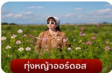
กู่หงุ้อออร์ดอส