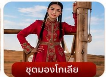
ชุดมองโกเลีย