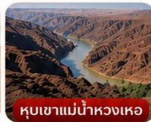
หุบเขาแม่น้ำหวงเหอ