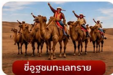
ขี้อูฐชมทะเลทราย