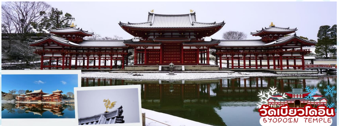
วัดเบียวโดอิน BYODOIN TEMPLE

นำทุกท่านเดินทางสู่ เมืองอุจิ (Uji) เมืองเล็กๆที่มีเสน่ห์ทางตอนใต้ของจังหวัดเมืองเกียวโต เป็นเมืองที่ขึ้นชื่อเรื่องชาเขียวอุจิมัทฉะ (Uji Matcha) และคาเฟ่น่ารักๆ ชาเขียวที่เมืองอุจิได้รับการยอมรับว่าเป็นชาเขียวคุณภาพดีที่สุดในญี่ปุ่น และยังเป็นเมืองที่เหมาะสมแก่การมาพักผ่อน เต็มไปด้วยวัดและโบราณสถานที่ได้รับมรดกโลกจากทาง Unesco