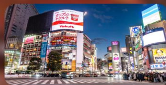
ซัปปิงชินจูกุ