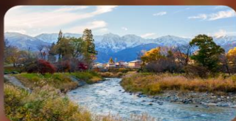
โออิเดะปาร์ค