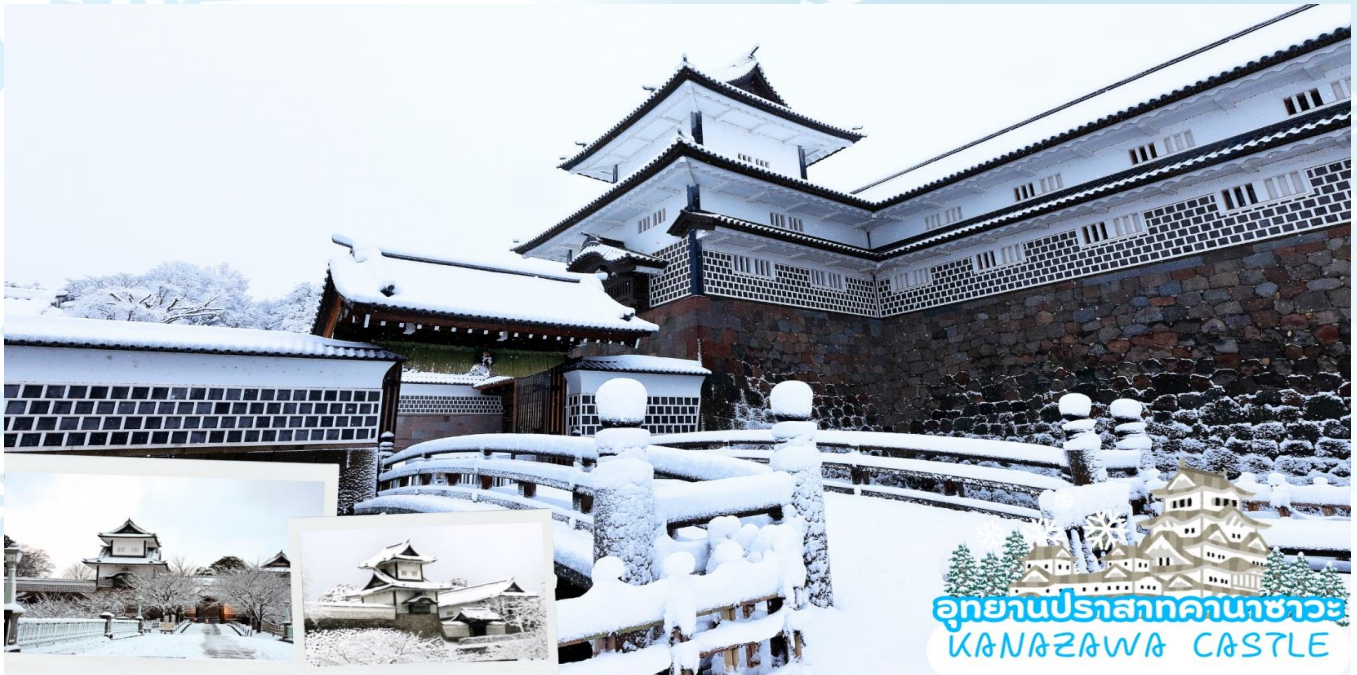
อุทยานปราสาทคานาซาวะ KANAZAWA CASTLE

อุทยานปราสาทคานาซาวะ (Kanazawa Castle) (ด้านนอก) คือสถานที่ทางประวัติศาสตร์ที่ครั้งหนึ่งเคยเป็นปราสาทของตระกูล Maeda ผู้ครองแคว้น Kaga และปัจจุบันเปิดให้นักท่องเที่ยวเข้าชมได้ร่วมกับสวน สวนเคนโรคุเอ็น ด้านนอก ที่มีกำแพงและคูเมืองที่ดูแลรักษาไว้อย่างสวยงามและมีตัวปราสาทที่สร้างขึ้นใหม่ เป็นสถานที่สำหรับการเรียนรู้ประวัติศาสตร์และประเพณีของคานาซาวะ สถานที่ที่แนะนำได้แก่ อิชิ ยากุระหรือหอนาฬิกาที่ถูกกู้มาจากอาคารโบราณ ฮาซึชิมะมง ทสึกุสึกิ ยากุระหรืออาคารที่เป็นหอนาฬิกาและโกจิเค็น นากายะหรือโรงเก็บของทางทหาร รวมทั้งกำแพงหินและสวนของปราสาท