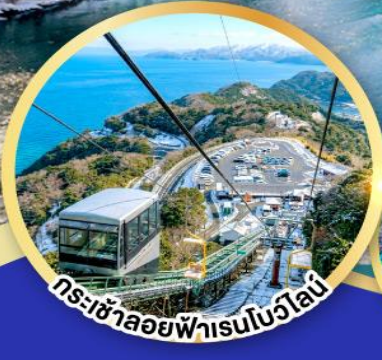
กระเช้าลอยฟ้าเรนโบว์ไลน์