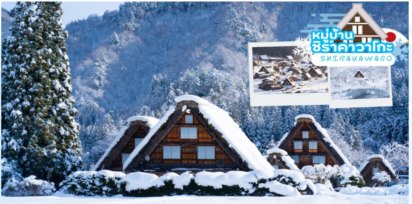
หมู่บ้านชิราคาวาโกะ SHIRAKAWAGO

กลางวัน รับประทานอาหารกลางวัน ณ ร้านอาหาร (มือที่ 1)