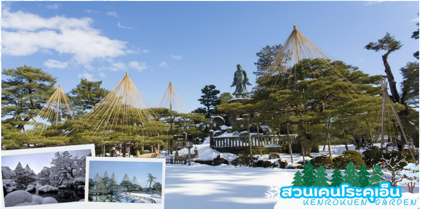
สวนเคนโรคุเอ็น KENROKUEN GARDEN

ล่องเรือสำราญโชกาวะ (Shogawa Gorge Cruise) จังหวัดโทยามะ เพลิดเพลินไปกับการล่องเรือชมทิวทัศน์ที่งดงามของธรรมชาติ ทั้ง 4 ฤดู ซึ่งเติมเต็มสีสันด้วยสีเขียวข่มและใบไม้เปลี่ยนสีที่ช่างงดงามวิจิตร แต่แต่ละฤดูกาลก็จะมีความสวยงามที่แตกต่างกันออกไป ล่องเรือไปกลับจากเขื่อนโคมะกิ (Komaki) ณ หุบเขาโชกาวะถึงออนเซ็นโอะมะกิ (Omaki) ใช้ระยะเวลาประมาณ 1 ชั่วโมง หุบเขาโชกาวะ แห่งนี้โด่งดังเรื่องทัศนียภาพหิมะที่ลึกลับและงดงาม ราวกับภาพวาดหมึกจีน ล่องเรือชมบรรยากาศที่รายล้อมไปด้วยหิมะและทิวทัศน์ที่งดงามของธรรมชาติอันอุดมสมบูรณ์