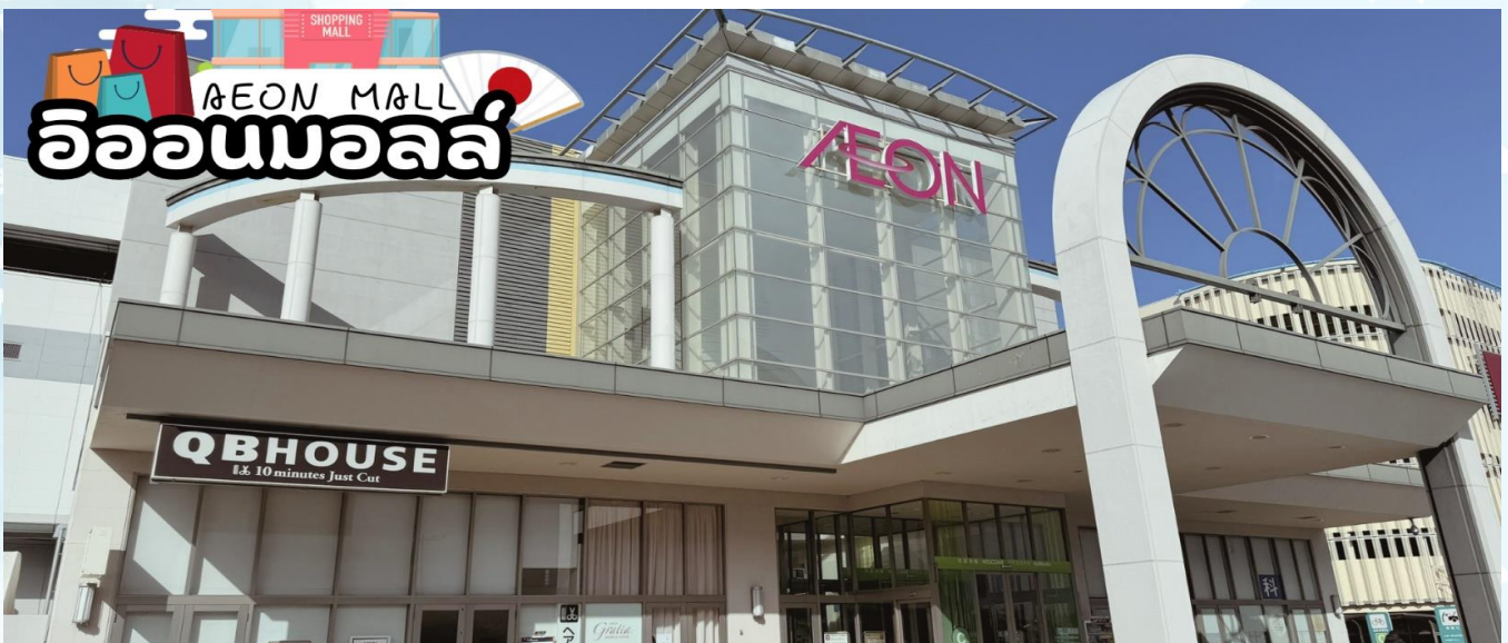
อีออนมอลล์

นำท่านสู่ ศาลเจ้านัมบะ ยาสากะ (Namba Yasaka shrine) เป็นศาลเจ้าหัวสิงโตยักษ์ ด้วยความสูง 17 เมตร ศาลเจ้าแห่งนี้มีชื่อเสียงในฐานะจุดรับพลังงานศักดิ์สิทธิ์ ในอดีตนั้นสถานที่แห่งนี้มีความเฟื่องฟูจนถึงขีดสุด แต่ภายหลังจากการเกิดไฟไหม้ในช่วงสงครามจึงลดระดับความสำคัญลง แต่ก็มีการบูรณะเปิดใหม่อีกครั้งในภายหลัง โดยที่หัวสิงโตขนาดใหญ่ที่นับเป็นลักษณะของศาลเจ้าแห่งนี้ได้สร้างขึ้นในปี พ.ศ. 2518 เช่นเดียวกันกับสิ่งปลูกสร้างอื่น ๆ ที่มีการบูรณะขึ้นใหม่หลังได้รับความเสียหายเนื่องจากสงคราม ซึ่งมีความเชื่อว่าปากของสิงโตนั้นจะช่วยกลืนกินสิ่งที่ไม่ดี ปิดเป่าความชั่วร้ายให้หายไปและนำพาโชคลาภเข้ามา คนส่วนใหญ่ที่มาสักการะมักขอพรเรื่องการเรียนหรือด้านการทำงานให้เกิดความสำเร็จตามที่มุ่งหวัง