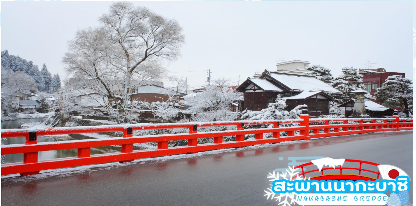
สะพานนาคะบาชิ NAKABASHI BRIDGE

สะพานนาคะบาชิ (Nakabashi Bridge) สะพานสีแดง ของย่านเมืองเก่า สะพานทอดข้ามแม่น้ำมิกากะวะที่ไหลผ่านใจกลางเมือง สะพานแห่งนี้ถือเป็นสัญลักษณ์ของเมืองทาคายามา