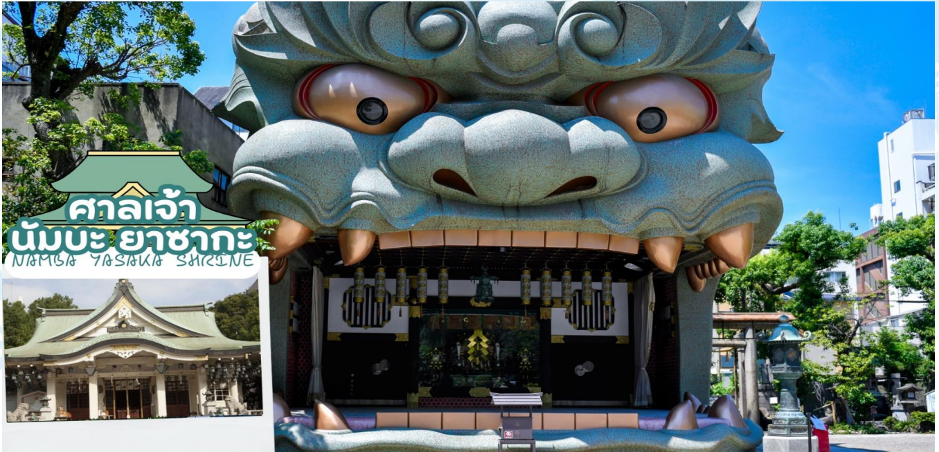
ศาลเจ้า นัมบะ ยาสากะ NAMBA YASAKA SHRINE

นำท่านสู่ ศาลเจ้านัมบะ ยาสากะ (Namba Yasaka shrine) เป็นศาลเจ้าหัวสิงโตยักษ์ ด้วยความสูง 17 เมตร ศาลเจ้าแห่งนี้มีชื่อเสียงในฐานะจุดรับพลังงานศักดิ์สิทธิ์ ในอดีตนั้นสถานที่แห่งนี้มีความเฟื่องฟูจนถึงขีดสุด แต่ภายหลังจากการเกิดไฟไหม้ในช่วงสงครามจึงลดระดับความสำคัญลง แต่ก็มีการบูรณะเปิดใหม่อีกครั้งในภายหลัง โดยที่หัวสิงโตขนาดใหญ่ที่นับเป็นลักษณะของศาลเจ้าแห่งนี้ได้สร้างขึ้นในปี พ.ศ. 2518 เช่นเดียวกันกับสิ่งปลูกสร้างอื่น ๆ ที่มีการบูรณะขึ้นใหม่หลังได้รับความเสียหายเนื่องจากสงคราม ซึ่งมีความเชื่อว่าปากของสิงโตนั้นจะช่วยกลืนกินสิ่งที่ไม่ดี ปิดเป่าความชั่วร้ายให้หายไปและนำพาโชคลาภเข้ามา คนส่วนใหญ่ที่มาสักการะมักขอพรเรื่องการเรียนหรือด้านการทำงานให้เกิดความสำเร็จตามที่มุ่งหวัง