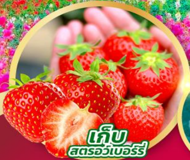
เก็บ สตรอว์เบอร์รี่