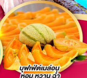
บุฟเฟ่ต์เมล่อนหอมหวานดำ