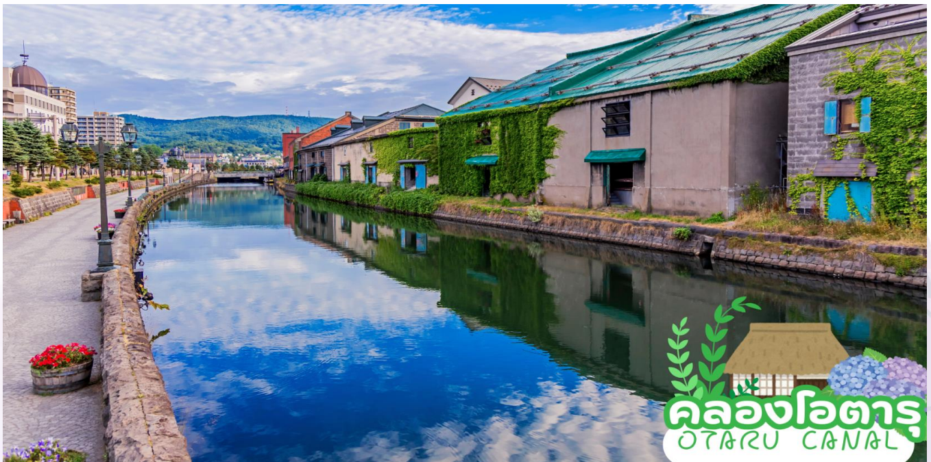
คลองโอตารุ OTARU CANAL

นำท่านชม คลองโอตารุ (Otaru Canal) ที่มีความยาว 1.5 กิโลเมตร ถือเป็นสัญลักษณ์ของเมืองโอตารุ โดยมีโกดังเก่าบริเวณโดยรอบปรับปรุงเป็นร้านอาหารเรียงรายอยู่ คลองแห่งนี้สร้างเมื่อปี 1923 โดยสร้างขึ้นจากการถมทะเล เพื่อใช้สำหรับเป็นเส้นทางขนถ่ายสินค้ามาเก็บไว้ที่โกดัง แต่ภายหลังได้เลิกใช้และมีการถมคลองครั้งหนึ่งเพื่อทำถนนหลวงสาย 17 แล้วเหลืออีกครั้งหนึ่งไว้เป็นสถานที่ท่องเที่ยว โดยมีการสร้างถนนเรียบคลองด้วยอิฐแดงเป็นทางเดินเท้ากว้างประมาณ 2 เมตร