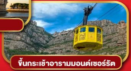
ขึ้นกระเช้าอารามมอนต์เซอรัลิต