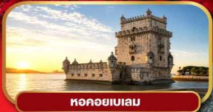
หอคอยเบเลม