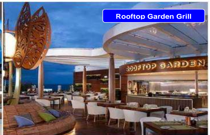
Rooftop Garden Grill