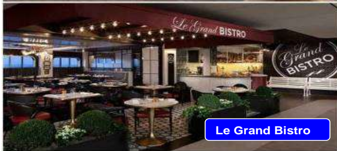
Le Grand Bistro