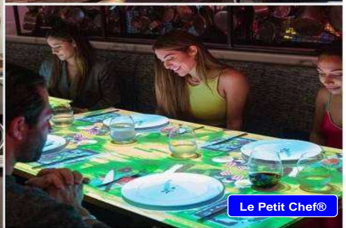
Le Petit Chef®