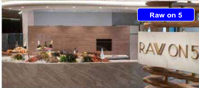
Raw on 5