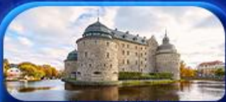
ปราสาทไอร์โบร

รหัสโปรแกรม : SEK168 9วัน 6คืน เที่ยวบินคือโฮลัม-ออกโคเปนเฮเกน