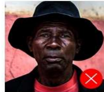
Back side is colored