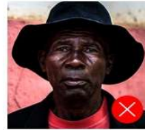
Back side is colored