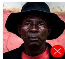
Back side is colored