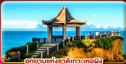
อุทยานแห่งชาติเกาะเหตง