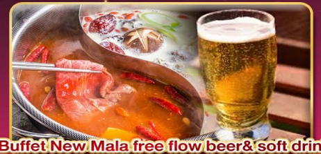
*Buffet New Mala free flow beer & soft drink