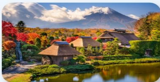
หมู่บ้านน้ำใสโอชิโนะฮักไก