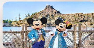
อีสระตามอริยาศัย 1 วัน