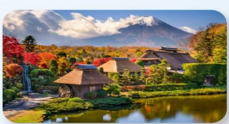
หมู่บ้านน้ำใสโอชิโนะฮัคโค