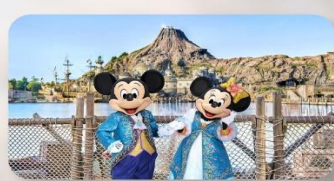
อีสระตามอริยาศัย 1 วัน