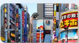
ช้อปปิ้งชินจุกุ