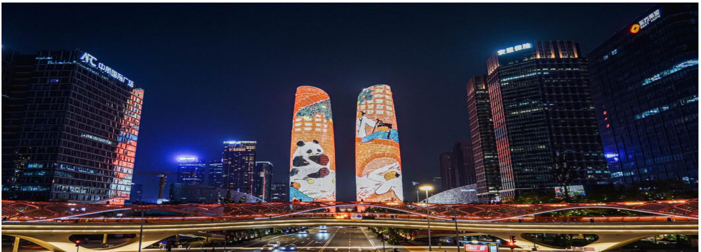
6. BIG PARADISE เวิลด์-ซิตี-ต้ากุกลาเซียร์-จี้จ้ายโกว 6วัน5คืน (TG) on Aug – Dec 2026

นำท่าน ชมวิวกกลางคืนถ้ำรูปคู่ตึกแฝดเทียนฟู่ (ด้านหน้า) จุดแลนด์มาร์คสำคัญเมืองเฉิงตูเป็นสองอาคารคู่แฝดที่อยู่ติดกัน ทรงแปลกตา เป็นตึกของศูนย์การเงินระหว่างประเทศเทียนฟู่ ซึ่งมีส่วนในการสร้างสนามบินเฉิงตู เทียนฟู่ และยังมี