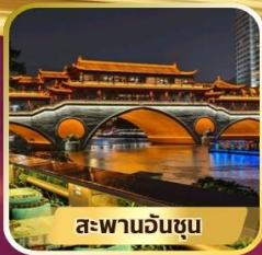
สะพานอันชุน