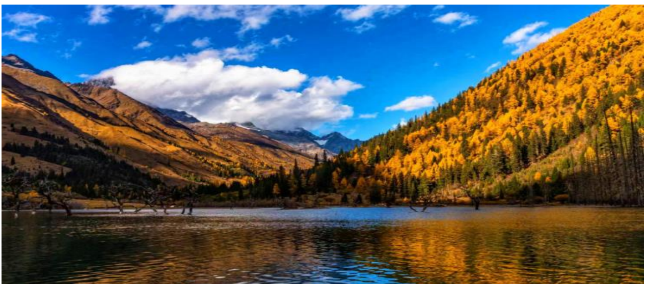
6. BIG PARADISE เส้นดู-สีคราม-ตาภูเขาเขียร์-จิวจายโกว 6วัน5คืน (TG) on Aug – Dec 2026

นำท่านเที่ยวชม หุบเขาซวงเฉียวโกว หรือหุบเขาสะพานคู่ มีระยะทาง 34.8 กม. มีพื้นที่รวม 216 ตารางกิโลเมตร เป็นจุดวิวทิวทัศน์ที่สวยงามที่สุด ชมความงามธรรมชาติของซวงเฉียวโกว(ลำน้ำสองสะพาน) ธารน้ำมีความยาว 35 กิโลเมตร มีทิวทัศน์ของภูเขาเป็นหลัก, ลำธารผ่านจุดต่างๆที่เป็นจุดทิวทัศน์ ไม่ว่าจะเป็น ชานแก้วจวง,เขาหนิวซิน, เย่เหรินเฟิง ถือเป็นจุดท่องเที่ยวแห่งหนึ่งของเขาสีครามที่รวบรวมจุดสำคัญหลายอย่างเข้าด้วยกันไว้ ชมไฮไลต์จุดชมวิว โดยมีจุดท่องเที่ยวแบ่งออกเป็น 3 ส่วนด้วยกันหุบเขาหิหยาง ล้อมรอบไปด้วยภูเขาทุกทิศทุกทาง ซึ่งอยู่ในส่วนที่ลึกที่สุดและจะได้เห็นธารน้ำแข็ง ภูเขากระจกแก้ว ภูเขาดวงอาทิตย์ ภูเขาดวงจันทร์ ยอดเขากระต่าย - ทุ่งหญ้าเหนียนหยูป่า ชมยอดเขารูปรางแปลกตา เช่น ยอดเขาพราน ยอดวังโปตาลา ยอดเขาเพชร - ภูเขาหญิงตั้งครรภ์ มีทิวทัศน์ที่สวยงามของท้องทุ่งกว้าง โดยมีฉากหลังเป็นภูเขาสูงปกคลุมด้วยหิมะขาว และในหุบเขาจะมีลำธารใสสะอาดรวมถึงต้นสนสูงสลัด้วยต้นไม้หลายหลากเฉดสี เช่น เขียวอ่อน เขียวแก่