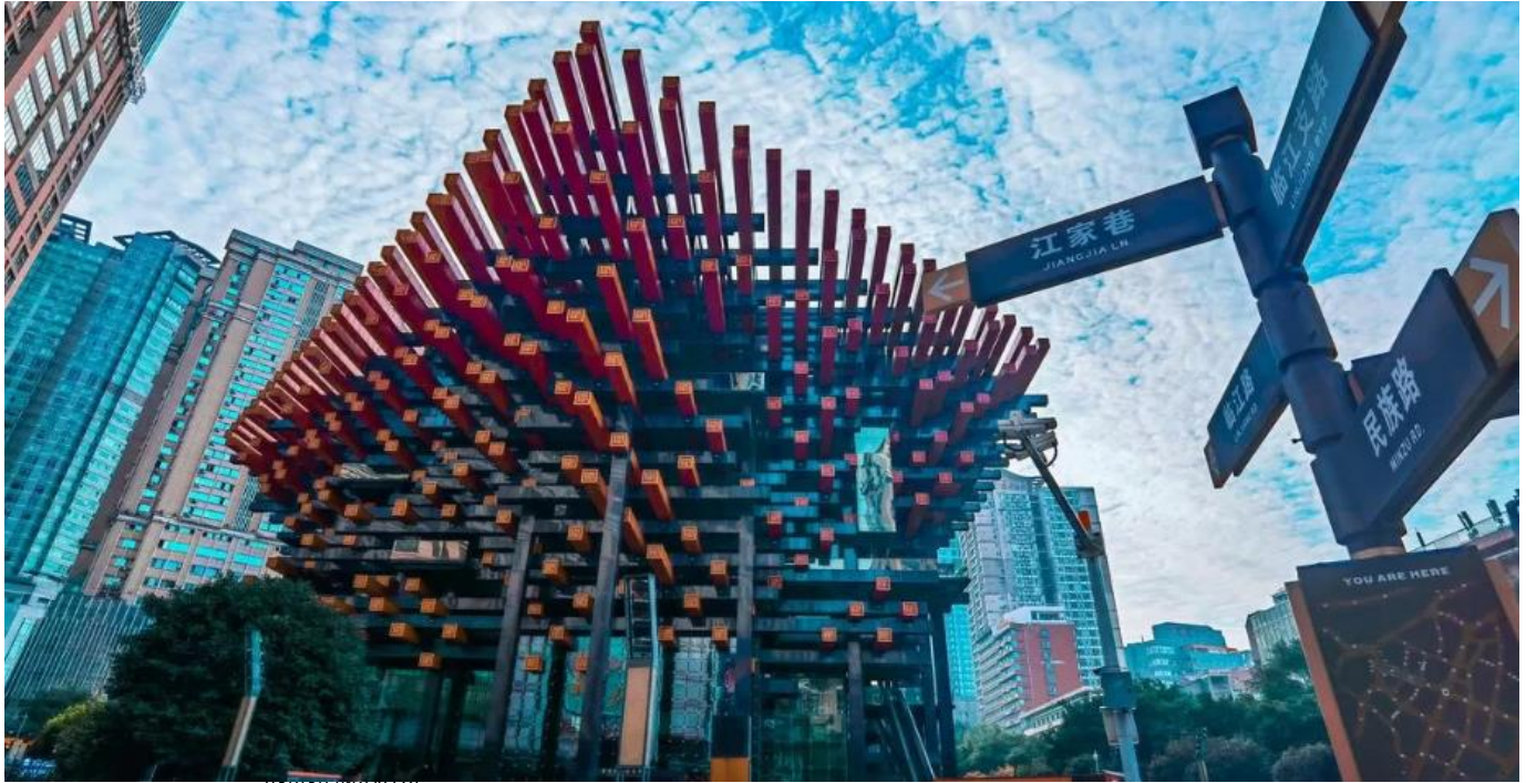
ตึกตะเกียบเทียน

ภายในเป็นศูนย์รวมศิลปะสมัยใหม่ ที่มีโรงละคร ห้องจัดนิทรรศการ และแกลเลอรี จัดกิจกรรมศิลปะที่หลากหลายตลอดทั้งปี ตึกตะเกียบจึงไม่ได้เป็นแค่อาคาร แต่เป็นสัญลักษณ์ทางสถาปัตยกรรมที่ผสมผสานความดั้งเดิมเข้ากับคามทันสมัยได้อย่างลงตัว สะท้อนถึงเอกลักษณ์ของเมืองฉงชิ่งได้เป็นอย่างดี