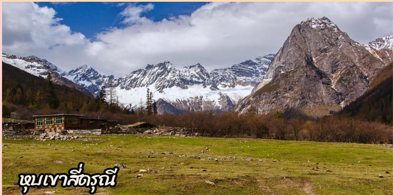
เขาลี่ดรุณี

(สถานที่ท่องเที่ยวขึ้นอยู่กับสภาพอากาศ และจุดท่องเที่ยวในอุทยานอาจมีการเปลี่ยนแปลงตามความเหมาะสม)