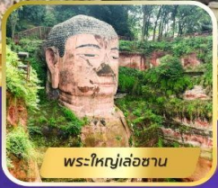
พระใหญ่เล่อซาน