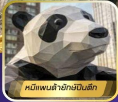
หมิป้านด้ายักษ์ปักกิ่ง