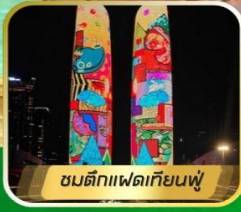
ซมติกแฟดเทียนฟู